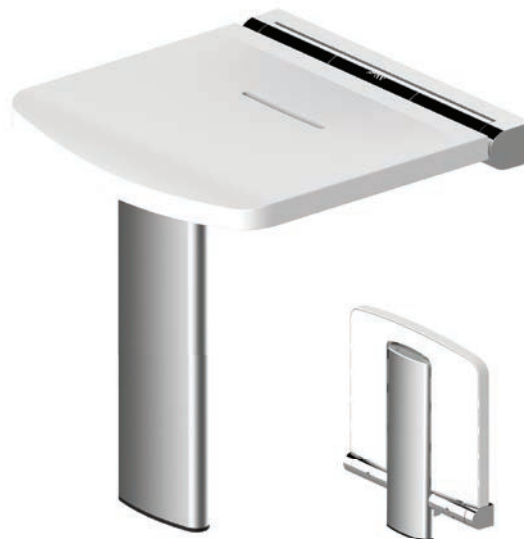
Schéma technique :