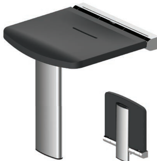
Schéma technique :