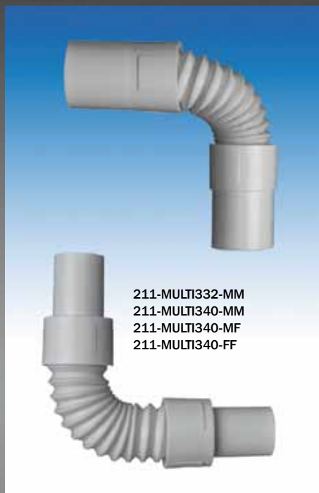
211-MULTI332-MM 211-MULTI340-MM 211-MULTI340-MF 211-MULTI340-FF