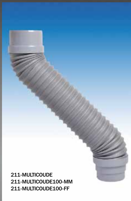
211-MULTICOUDE 211-MULTICOUDE100-MM 211-MULTICOUDE100-FF