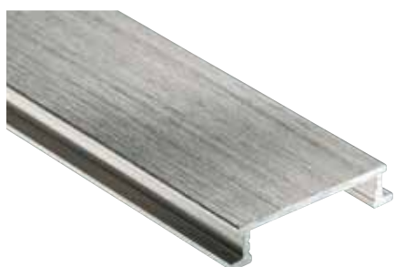
Schlüter®-DESIGNLINE-AGBE anodisé brossé (-ATGB)

DESIGNLINE-E est fabriqué à partir de bandes de tôle d'acier inoxydable V2A (alliage 1.4301 = AISI 304). L'acier inoxydable convient particulièrement pour des applications qui nécessitent non seulement une résistance mécanique élevée, mais aussi une bonne résistance aux produits chimiques tels que les acides, les alcalins et les produits de nettoyage. L'acier inoxydable ne résiste pas à tous les produits chimiques ; il est attaqué par des produits tels que l'acide chlorhydrique ou l'acide fluorhydrique ou par du chlore et des alcalins à partir d'une certaine concentration. Il peut également être attaqué par exemple par de l'eau saline ou de l'eau de mer. Il convient donc de définir au préalable les sollicitations prévisibles.