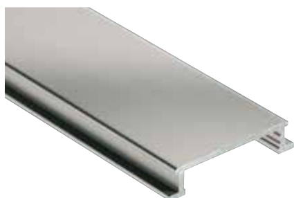
Schlüter®-DESIGNLINE-AME anodisé mat (-AT)