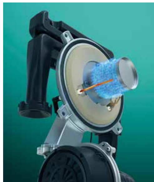
Technologie ioniDETECT : une combustion optimale