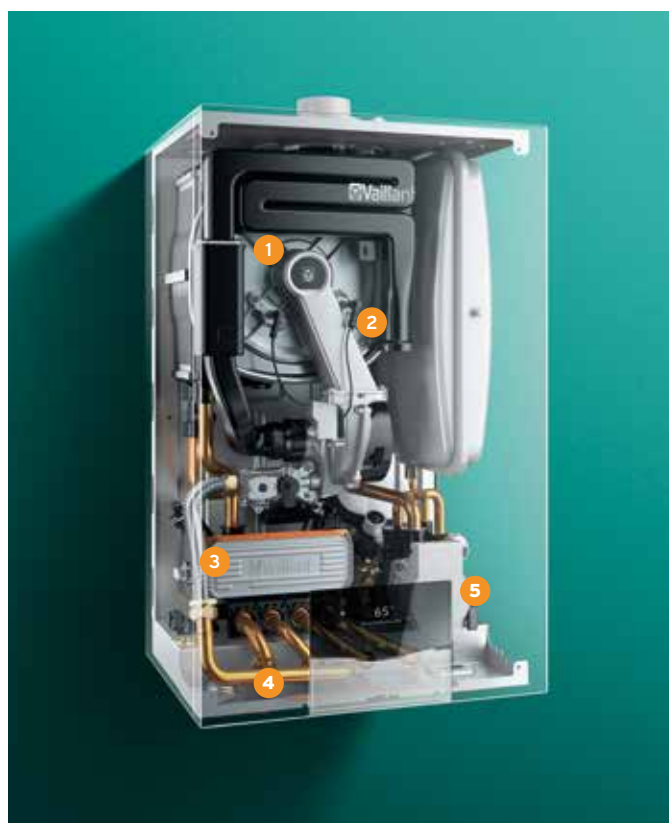
ecoTEC plus, vue intérieure aux rayons X.

réouverture du robinet pour se rincer. Vous profitez ainsi d'un logement où il fait bon vivre, avec une température agréable et de l'eau chaude disponible rapidement dès que vous en avez besoin.