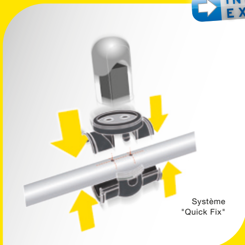
Système "Quick Fix"