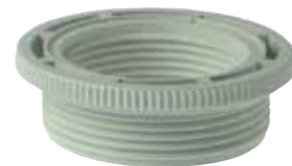
Réduction 1"1/2 x 2"